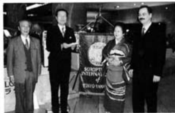
右より、トーマス支配人、山内元会長、黒河内支援委員長、高橋常任理事